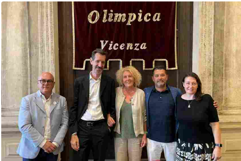
I Presidenti, da sx, di Venezia, Padova, Belluno, Treviso e Vicenza

IN PRIMO PIANO IN VETRINA Redazione 05/09/2023